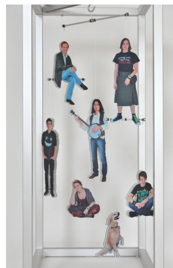
Familienporträt (Detail) 85 x 38 x 38 cm