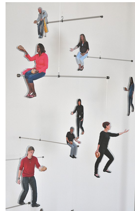
Firmenporträt, 200 x 200 x 100 cm

Ein einmaliges, hervorstechendes, künstlerisch wertvolles Repräsentations-Objekt für den Firmeneingangsbereich, eine Kombination von Fotografie und kinetischem Mobile, welches allein durch die Luftzirkulation im Raum ständig in Bewegung bleibt und so die Dynamik und das innere Gleichgewicht Ihrer Firma symbolisch zum Ausdruck bringt.